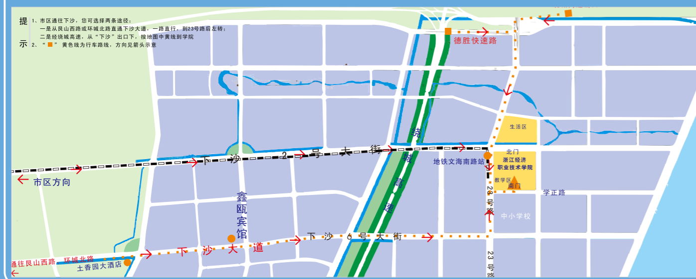
浙江经济职业技术学院交通示意图

浙江经济职业技术学院 ZHEJIANG TECHNICAL INSTITUTE OF ECONOMICS